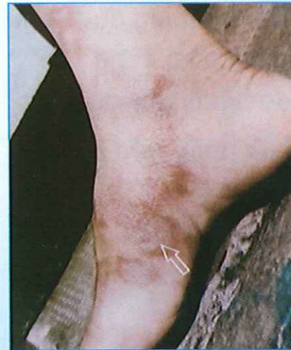
Hình 4: Da thay đổi màu sắc, nổi cao và mất cảm giác.