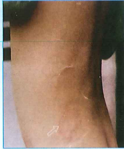
Hình 2: Da thay đổi màu sắc và nổi cao mất cảm giác.