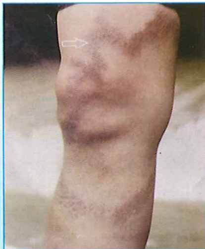
Hình 3: Da thay đổi màu sắc, nổi cao, lan toả, mất cảm giác.