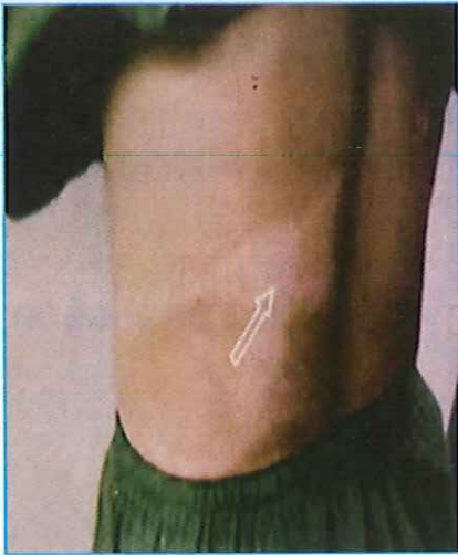
Hình 1: Da thay đổi màu sắc, mất cảm giác.